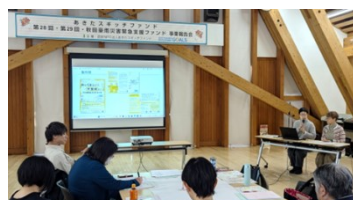
団体名 不登校・登校しぶりを支えるプロジェクト(秋田市) 事業名 みんなで知ろう!不登校の『キ』