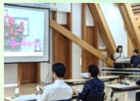
▲ 第30回スギッチファンド 審査会の様子