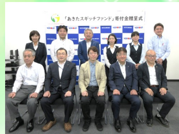
▲ ヨコウン株式会社から寄付金を頂きました。(記念撮影)