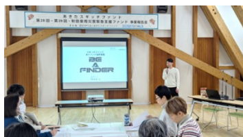
団体名 つながる一と(藤里町) 事業名 BE A FINDER

始めに、つながる一と(第28回)、不登校・登校しぶりを支えるプロジェクト(第29回)、いきいきサロン・ラベンダーの会(秋田豪雨災害緊急支援)から事業報告の発表をしていただきました。