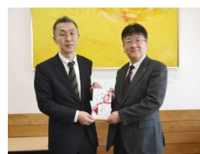
▲秋田県庁職員有志の皆さまから 寄付金を頂きました。