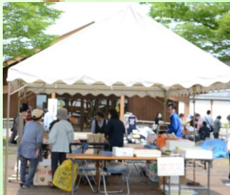
▲ フリーマーケット（遊学舎）