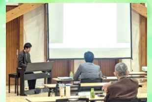
▲ 第31回スギッチファンド 審査会の様子