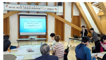
団体名 いきいきサロン・ラベンダーの会 事業名 炊き出して食べてみんなを元気に! & ADL高齢者体操で元気になるう!

その後は3グループに分かれて事業報告を行い、成果や課題を共有しました。互いに知りたいことを質問するなど自然に交流が生まれていました。団体同士が話しやすい雰囲気になったところで「団体の抱える悩みごとや困りごと」をテーマにしてグループワークを行い、どうすれば解決に繋がるのかを皆で考えました。