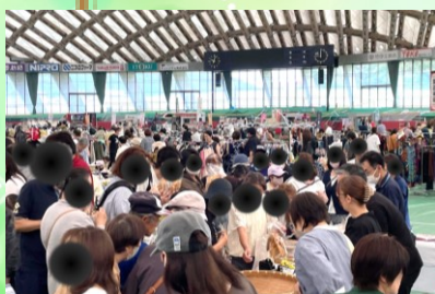
▲ 大館市エコフェア&マンモスフリーマーケット（ニプロハチ公ドーム）