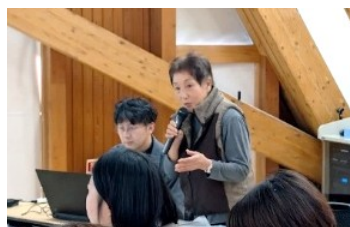
団体名： まちなかトープ

空き家を活用し、住民同士の交流や生きがいづくりなどを図ることを目的に、地域の居場所として古民家を改修しました。地域住民が気軽に集える場所として、子ども食堂や見守りの場としても活用できるよう整備しました。5月24日に開館し、ガラス工芸展や明治時代からの家具・食器類の展示会を開催したほか、地域サロンも実施し、多くの方が訪れました。今後も、古民家と歴史ある調度品や書物等を活かしながら、地域に親しまれる居場所として運営するとともに、より多くの方に知ってもらえるよう取り組みます。