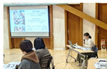
団体名： 食物アレルギーと共に あゆむ会・もぐもぐ