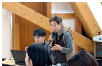
団体名： まちなかトープ

空き家を活用し、住民同士の交流や生きがいづくりなどを図ることを目的に、地域の居場所として古民家を改修しました。地域住民が気軽に集える場所として、子ども食堂や見守りの場としても活用できるよう整備しました。5月24日に開館し、ガラス工芸展や明治時代からの家具・食器類の展示会を開催したほか、地域サロンも実施し、多くの方が訪れました。今後も、古民家と歴史ある調度品や書物等を活かしながら、地域に親しまれる居場所として運営するとともに、より多くの方に知ってもらえるよう取り組みます。