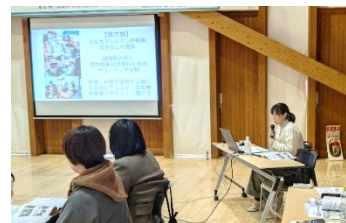
団体名： 食物アレルギーと共に あゆむ会・もぐもぐ